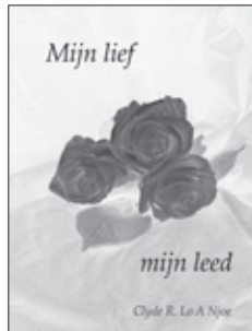
De omslag van de nieuwe dichtbundel.