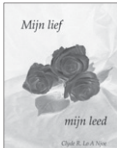
De omslag van de nieuwe dichtbundel.