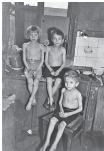
Bewoners zitten in de Hongerwinter bij elkaar in een kamer zonder vensters, nadat deze gesloopt zijn om te dienen als brandhout, Amsterdam 1944. In contrast met de Hongerwinter leeft Esther in de jaren zeventig een bestaan waarbij ze vooral geniet van luxe.